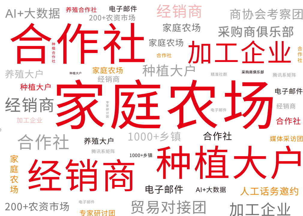
职业 占比 家庭农场及合作社 47.74% 经销代理 41.27% 企业管理 31.12% 政府行政/行业协会 17.83% 广告/媒体从业 7.85% 其他 7.03%